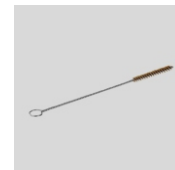
Obj.č. 7026 Kartáček na čištění trysek