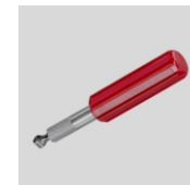
Obj.č. 7020 Začišťovací škrabák