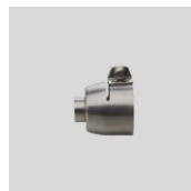
Obj.č. 4007 Adaptér se závitem M10