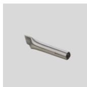
Obj.č. 5015 Stehovací tryska rychlosvařovací