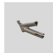
Obj.č. 5001 Trojhranná tryska rychlosvařovací 7 mm