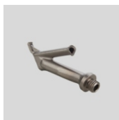
Obj.č. 5002 Trojhranná tryska šroubovací 5,7 mm (M10)