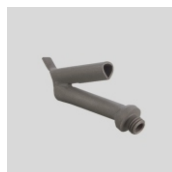
Obj.č. 5009 Trojhranná tryska šroubovací 7,5 mm (M10)