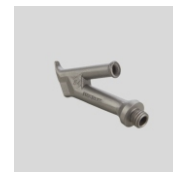
Obj.č. 5006 Kulatá tryska šroubovací Ø 4 mm (M10)