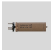
Obj.č. 2007 Topné tělísko 1500W / 230V