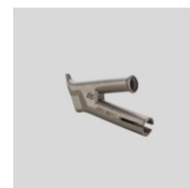
Obj.č. 5012 Kulatá tryska rychlosvařovací Ø 5 mm