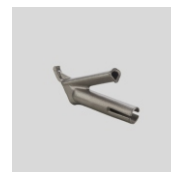
Obj.č. 5000 Trojhranná tryska rychlosvařovací 5,7 mm