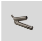
Obj.č. 5014 Trojhranná tryska rychlosvařovací 7,5 mm