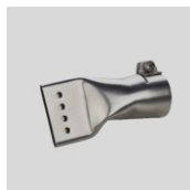
Obj.č. 4004 Přepřátovací tryska 40 mm, děrovaná