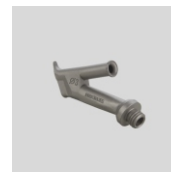
Obj.č. 5005 Kulatá tryska šroubovací Ø 3 mm (M10)