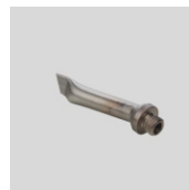
Obj.č. 5004 Stehovací tryska šroubovací (M10)