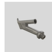
Obj.č. 5007 Kulatá tryska šroubovací Ø 5 mm (M10)