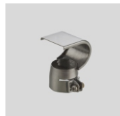
Obj.č. 5016 Smršťovací reflektor