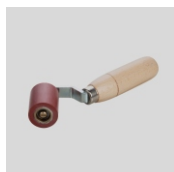
Obj.č. 6995 Přítlačný váleček 45 mm / 45° jednoramenný s ložisky