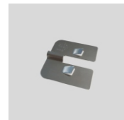
Obj.č. 5021 Vodící ližiny pro srpkovitý nůž