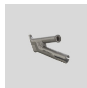
Obj.č. 5011 Kulatá tryska rychlosvařovací Ø 4 mm