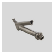
Obj.č. 5003 Trojhranná tryska šroubovací 7 mm (M10)