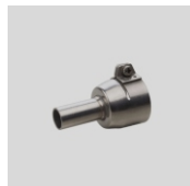
Obj.č. 4005 Smršťovací tryska 15 mm