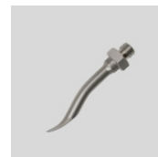
Obj.č. 5017 Stehovací tryska šroubovací, zahnutá (M10)