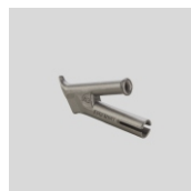
Obj.č. 5010 Kulatá tryska rychlosvařovací Ø 3 mm