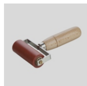
Obj.č. 6996 Přítlačný váleček 80 mm dvouramenný s ložisky