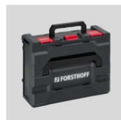
Obj.č. 7025 Převážný kufr systém metaBOX