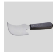
Obj.č. 7010 Srpkovitý nůž