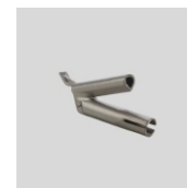
Obj.č. 5013 Trojhranná tryska rychlosvařovací 5 mm