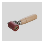
Obj.č. 6997 Přítlačný váleček 45 mm jednoramenný s ložisky