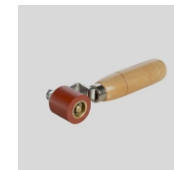
Obj.č. 6994 Přítlačný váleček 28 mm jednoramenný s ložisky