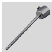
Obj.č. 4000.V Základní tryska 5 mm / 150 mm